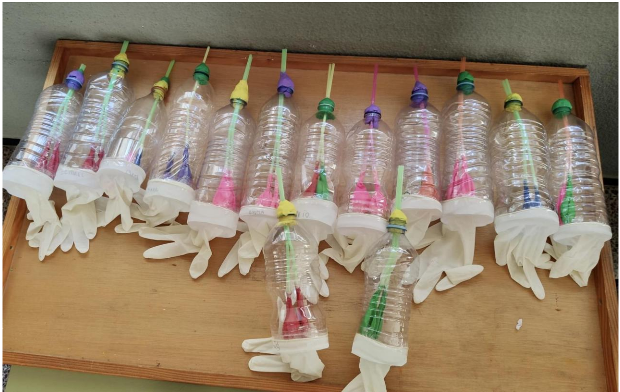
Primer C - Escola Taijà